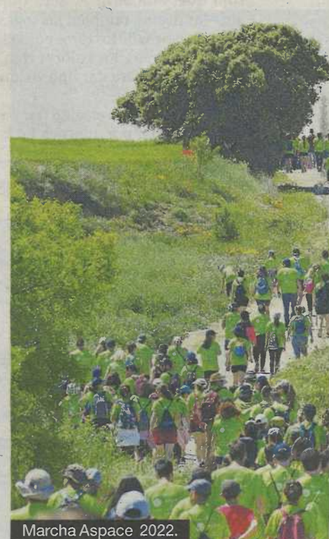
Marcha Aspace 2022.

Este año, gracias a la celebración de la XI Marcha Aspace Huesca y a todos sus colaboradores, se hará posible el inicio de un proyecto de Residencia vivienda para 15 personas situada en el Casco Urbano de la capital altoaragonesa. Se trata de una acción esencial para dar respuesta a una de