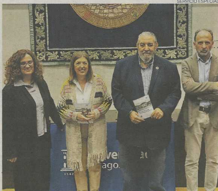
El folleto se presentó este martes en el Paraninfo.

El rectorado es el lugar donde trabajan las personas que dirigen