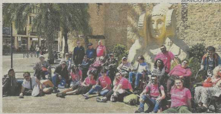
El grupo del CCR, junto al Museo Arqueológico de Elche.

Hasta la localidad alicantina de Moraira, a orillas del mar Mediterráneo, se desplazó el pasado jueves el grupo del Centro Cultural y Recreativo (CCR) formado por 16 personas con discapacidad física, acompañadas por siete voluntarias y dos técni-